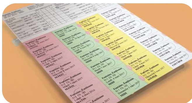
Exemple de pilulier