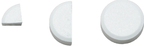
Coupé en 4 Coupé en 2 Complet

Certains comprimés sont coupés en 4 ou en 2, comme ceux montrés ici. C'est normal.