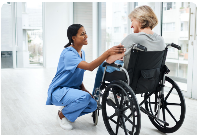
L'injection de toxine botulique (Botox) dans la vessie

Il faudra peut-être changer la dose de Botox ou le moment du traitement pour cette raison.