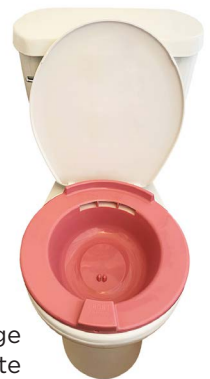
Bassin de bain de siège installé sur une toilette

Faites-le 3 fois par jour. Continuez pendant 5 jours ou selon les indications de votre médecin.