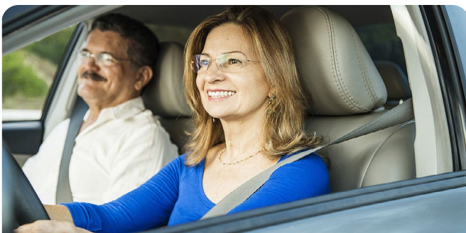
L'échographie et la biopsie de la prostate

Il faut aviser la Clinique d'urologie au 514 890-8000, poste 36411 si vous :