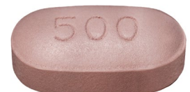
comprimés de 500 mg