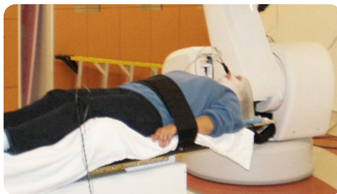
Traitement de stéréotaxie en cours.

Vous aurez environ 3 visites à l'hôpital dans le but de vous préparer à recevoir vos traitements.