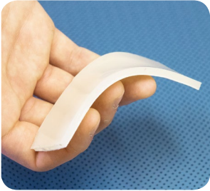
La plaque de gel