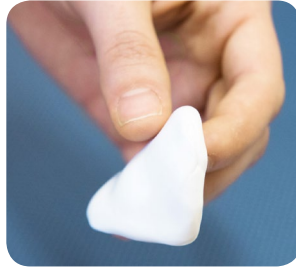
Le moule d'élastomère

La plaque de gel et le moule d'élastomère ont pour effet d'améliorer la souplesse de la peau, sa couleur et diminuer son enflure. Leur action est due à la chaleur et à l'humidité qu'ils créent sur la peau. Ils ne renferment aucun médicament et aucun produit ne traverse la peau.