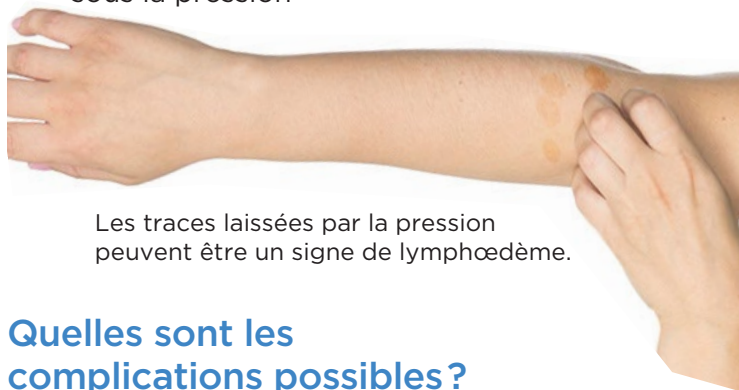
Les traces laissées par la pression peuvent être un signe de lymphœdème.