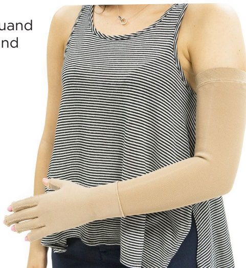
Patiente portant un manchon et un gant compressifs.