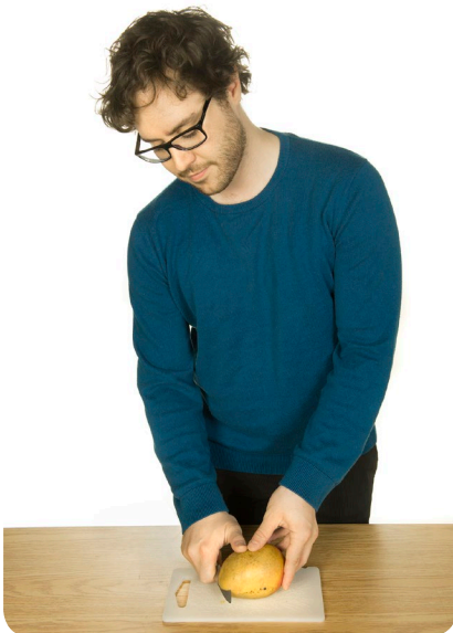
Bien manger et faire des activités légères peut aider à diminuer la fatigue.

Toutefois, il est possible d'en diminuer les effets. En changeant simplement certaines habitudes de vie.