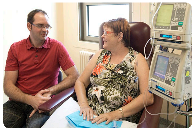
Traitement de chimiothérapie par voie intraveineuse.

La fatigue peut rester pendant toute la durée de votre traitement. Dans certains cas, elle peut aussi continuer plusieurs mois après la fin des traitements.