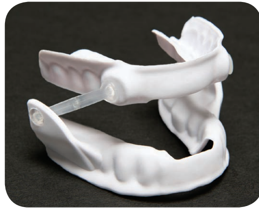
Orthèse pour avancer la mâchoire.